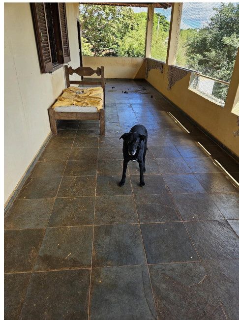
Área externa de um dos cômodos onde dois animais dormem