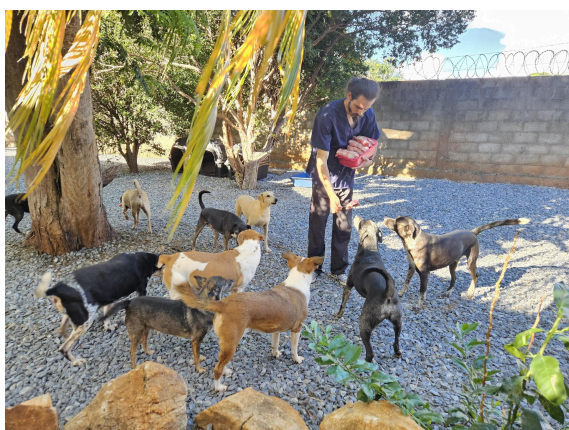
Fornecimento de alimento aos animais Data: 27/02/2025