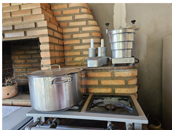
Triturador de vegetais Autoria: Carolina Rodrigues Bordignon Data: 27/02/2025