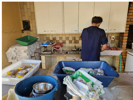
Preparação de alimentos Data: 27/02/2025