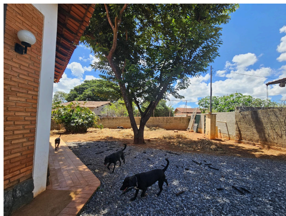
Área externa do abrigo Data: 27/02/2025