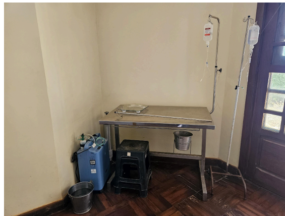
Mesa cirúrgica e equipamentos Data: 27/02/2025