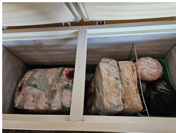
Alimentos armazenados em freezer Data: 27/02/2025