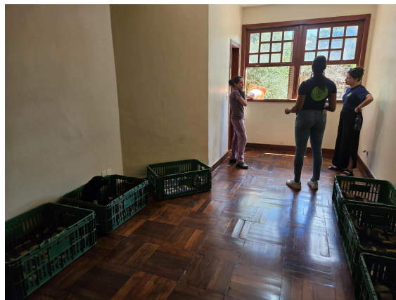
Cômodo com camas onde os animais dormem