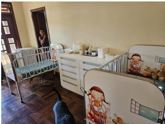
Sala veterinária – vista geral Data: 27/02/2025