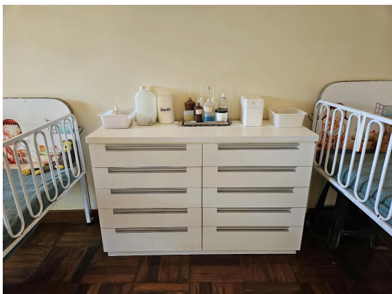
Armário de medicamentos Autoria: Carolina Rodrigues Bordignon Data: 27/02/2025