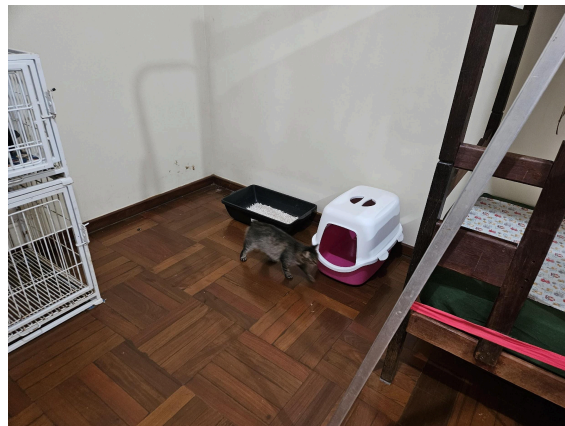
Cômodo onde a gata fica instalada Data: 27/02/2025