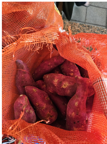
Alimentos a serem utilizados Autoria: Carolina Rodrigues Bordignon Data: 27/02/2025

Posteriormente, a equipe seguiu para o interior da casa, local em que ficam os cômodos onde os animais dormem, com as respectivas camas, além da cozinha onde os alimentos cozidos são preparados. A CASA fornece aos animais alimentação natural, constituída de vegetais variados, vísceras, ossos carnudos, dorso de frango e ovos, resguardada a particularidade de restrição de dieta para cada animal de acordo com diversas questões de saúde. Os alimentos são ofertados aos animais uma ou duas vezes ao dia, dependendo da necessidade e dieta de cada um. Geralmente os que comem ossos, ovos e carne crus são alimentados uma vez ao dia, pois ficam saciados com uma única refeição. Aqueles que consomem carnes e ovos cozidos geralmente recebem alimentação duas vezes ao dia. Salienta-se que todos os vegetais são cozidos e foi verificada a disponibilidade de água em abundância durante todo o período que a equipe esteve presente.