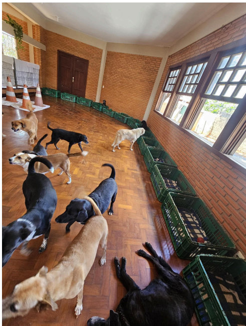
Cômodo com camas onde os animais dormem