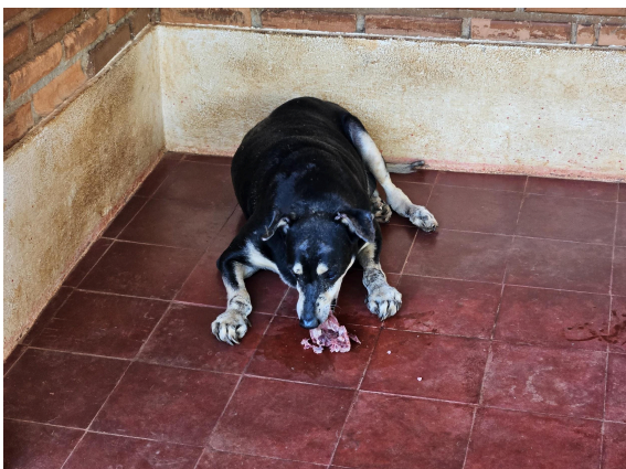
Animal se alimentando