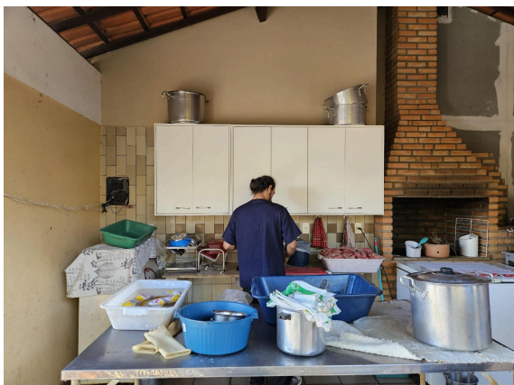
Cozinha e preparação dos alimentos Autoria: Carolina Rodrigues Bordignon Data: 27/02/2025