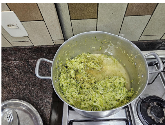
Abobrinha ralada e cozida Data: 27/02/2025