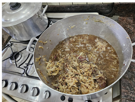
Batata doce ralada e cozida Autoria: Carolina Rodrigues Bordignon Data: 27/02/2025