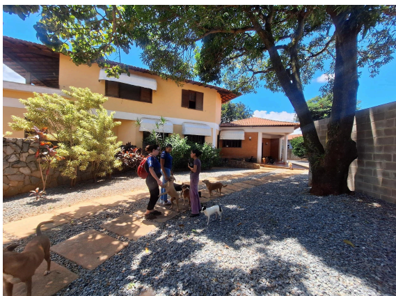
Equipe em visita ao projeto Data: 27/02/2025