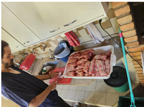
Preparação de alimentos Data: 27/02/2025