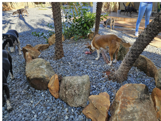
Animais se alimentando