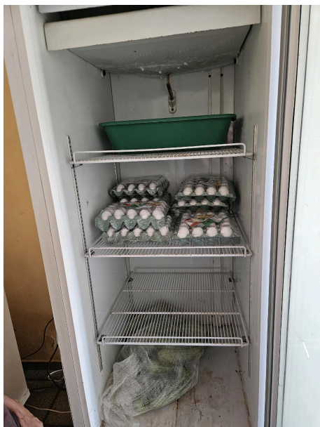
Alimentos armazenados em geladeira Data: 27/02/2025