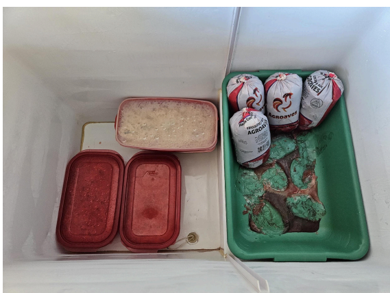
Alimentos armazenados em freezer Data: 27/02/2025