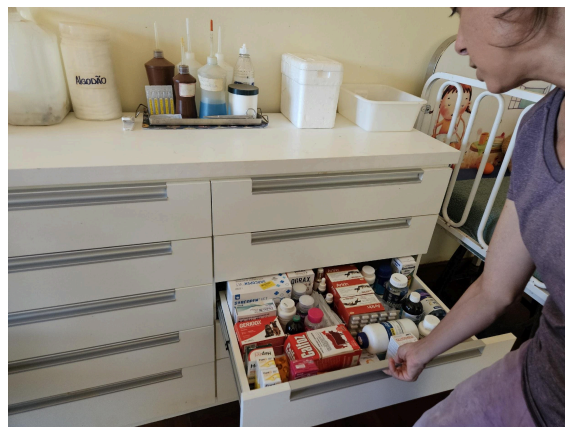
Armário de medicamentos Autoria: Carolina Rodrigues Bordignon Data: 27/02/2025