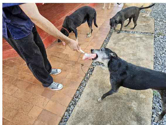
Fornecimento de alimento aos animais Data: 27/02/2025