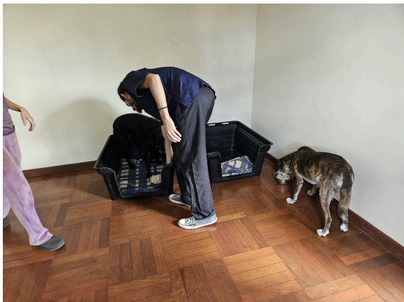
Cômodo onde dois animais ficam instalados Data: 27/02/2025